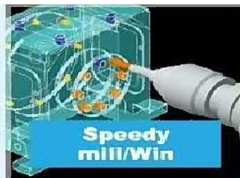
2D CAD/CAM Speedy mill/Win