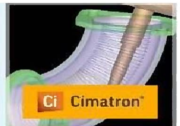
3D CAD/CAM Cimatron