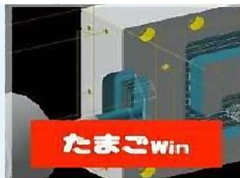
2D CAD/CAM たまご Win