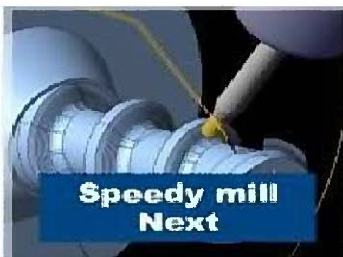
2D・3D統合CAD/CAM Speedy mill Next