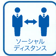
ソーシャルディスタンス