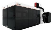
CFRP用炭酸ガス3次元レーザ加工機 CVシリーズ