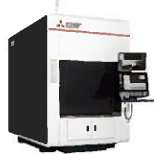
ワイヤ・レーザ金属3Dプリンタ AZ600シリーズ