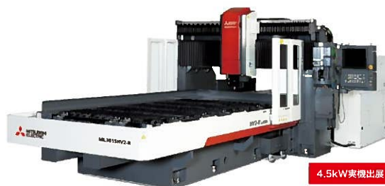
炭酸ガスレーザ加工機 HV2-Rシリーズ