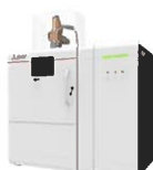
電子ビーム金属3Dプリンタ EZ300シリーズ